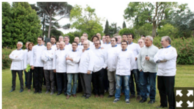
Chef Euro Toques

L'11 e il 12 gennaio assemblea generale dei cuochi di EuroToques per eleggere il nuovo Presidente Internazionale. Per Expo 2015 annunciata una staffetta di chef stellati in un nuovo relais di lusso sul lago di Como