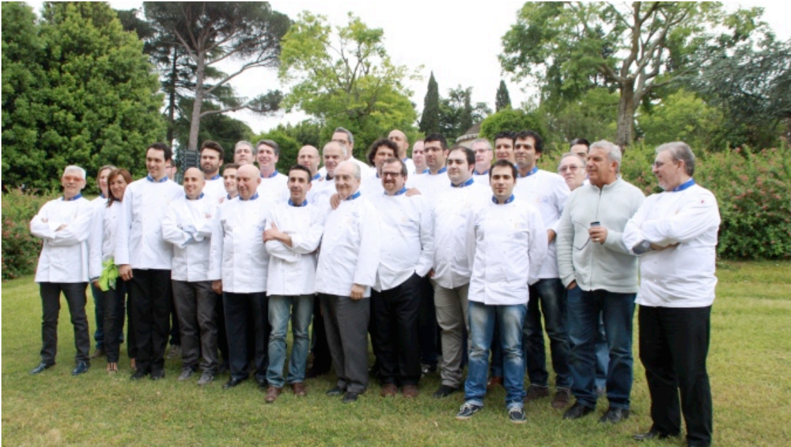
Chef Euro Toques

Como, 5 gennaio 2014 - Comincia il conto alla rovescia per Expo 2015 e l'Italia fa valere la propria leadership in ambito culinario . Sarà, infatti, l'elegante Galleria Civica di Campione d'Italia a ospitare l'assemblea generale straordinaria di Euro-Toques International , l'associazione riconosciuta dall'UE che raggruppa i più importanti chef d'Europa e che annovera anche il Maestro Gualtiero Marchesi tra i suoi fondatori . Delegazioni internazionali e soci di Euro-Toques Italia sono stati chiamati a raccolta per domenica 11 e lunedì 12 gennaio 2015 dal pluripremiato chef Enrico Derflingher , attuale vertice italiano e vicepresidente europeo con delega per Expo 2015, e da Bernard Fournier , consigliere e tesoriere di Euro Toques Italia. Si dovrà procedere, infatti, con l'elezione del nuovo Presidente in sostituzione del francese Didier Peschard, dimissionario. Non solo. La due giorni sarà anche l'occasione per un confronto ad altissimi livelli tra addetti ai lavori sui temi dell'alta gastronomia europea, della diplomazia e, soprattutto, di Expo 2015 .